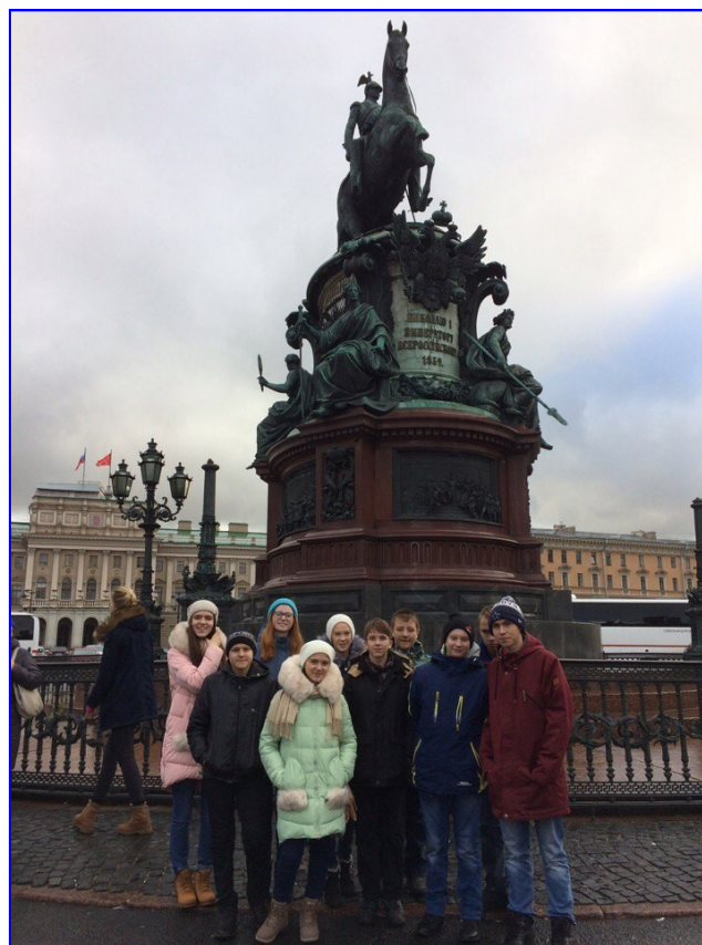
У памятника Медный всадник