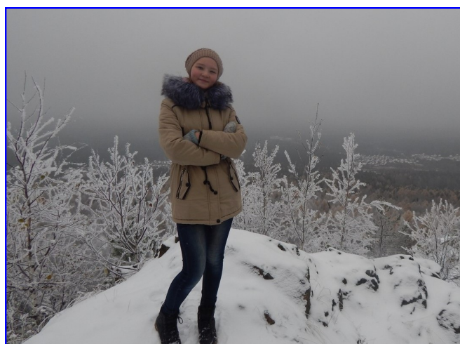
На вершине горы