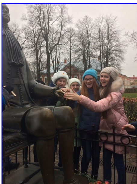
Памятник Петру I в Петропавл овской крепости