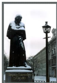
Памятник на Коюшенной